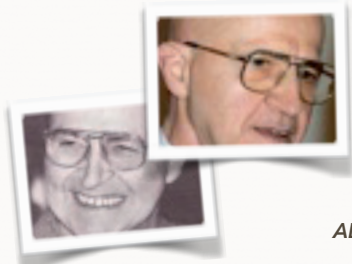
ALFRED A. TOMATIS

Alfred A. Tomatis (1920-2001), medico otorinolaringoiatra francese, ha sviluppato una teoria originale sulle funzioni dell'organo dell'Orecchio, che ha presentato in molte opere scientifiche e divulgative di successo.