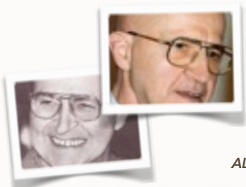
ALFRED A. TOMATIS

Alfred A. Tomatis (1920-2001), medico otorinolaringoiatra francese, specializzato nel trattamento dei disturbi dell'udito e del linguaggio, ha sviluppato una teoria originale dell'ascolto, che ha presentato in molte opere scientifiche e divulgative di successo.